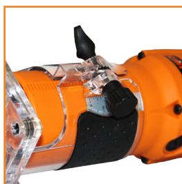
Regulacja głębokości frezowania 0-40 mm